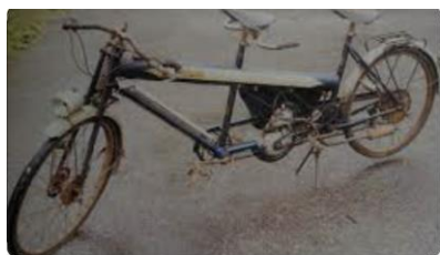
Tandem, Marke William, 1950

Un moteur à essence de 48\text{cm}^3 est monté sur le vélo.